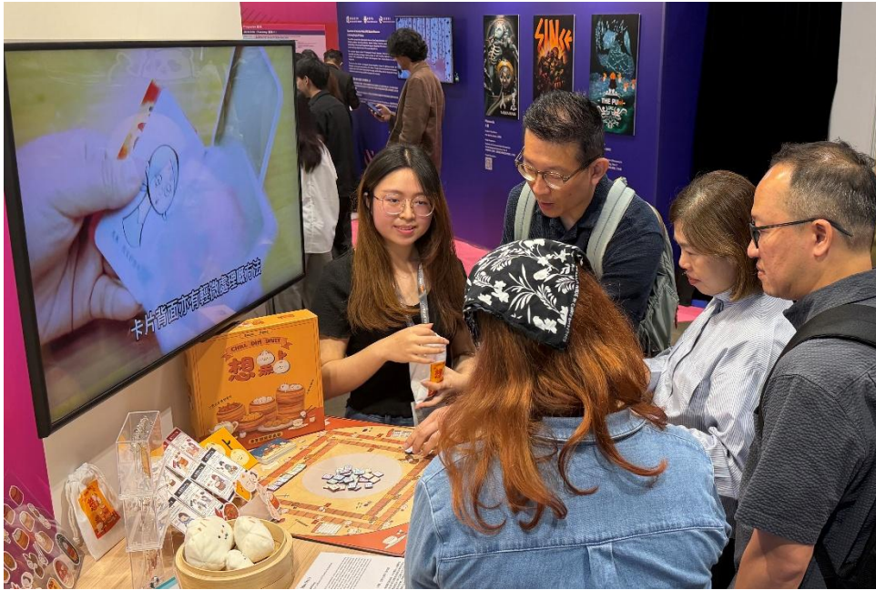
圖四：恒生大學學生的作品，連續第二年獲邀於「香港國際授權展——香港授權新力量展區」展出。